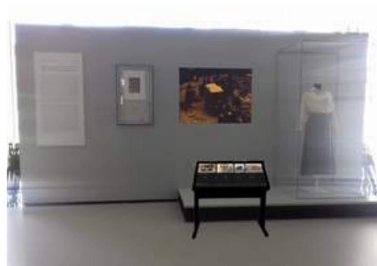
Installation interactive dans le parcours permanent