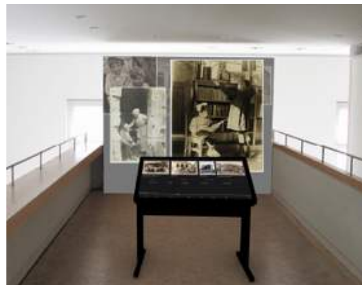
Installation interactive pendant l'exposition temporaire