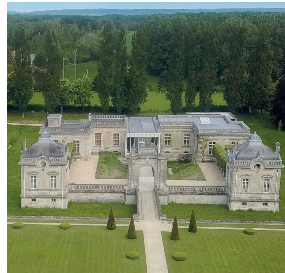
Musée franco-américain du Château de Blérancourt.

Après la restauration du Pavillon historique en 1930 puis la reconstruction du Pavillon des Volontaires en 1938, réhabilité et agrandi en 1989, la nouvelle extension permet de déployer les collections permanentes autour de trois grandes thématiques que sont les Idéaux des Lumières à l'origine des premières alliances entre les deux nations, les Épreuves pendant lesquelles France et États-Unis ont combattu côte-à-côte et les Arts , sujet de nombreux échanges transatlantiques.