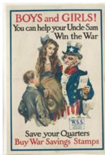
James Montgomery Flagg (1877-1960), Garçons et Filles, vous pouvez aider votre Oncle Sam à gagner la guerre, Affiche