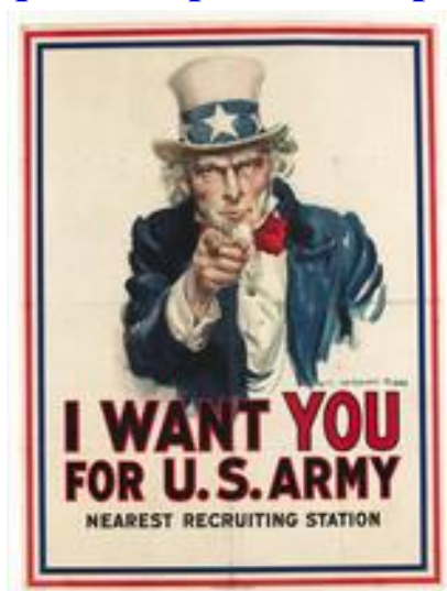
James Montgomery Flagg (1877-1960) I want you for U-S Army, Nearest recruiting Station, affiche