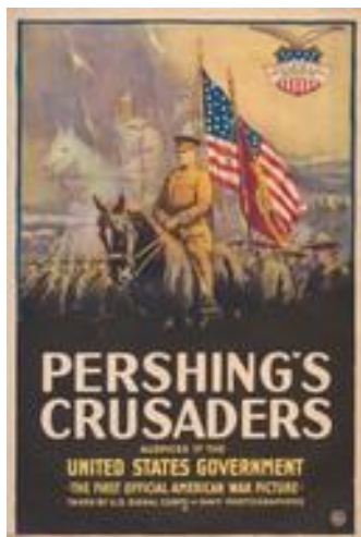
Pershing's Crusaders