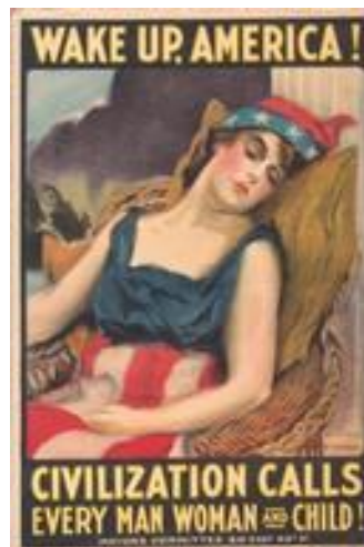
James Montgomery Flagg (1877-1960), Wake Up, America!