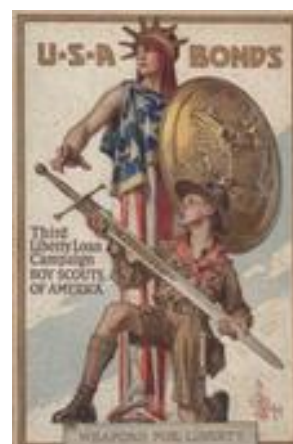
Joseph C. Leyendecker, USA BONDS Third Liberty Loan Campaign