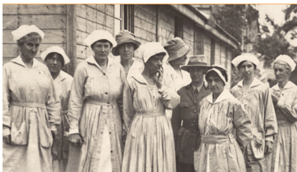
Les Volontaires, Blérancourt

i Accès sur présentation du billet d'entrée