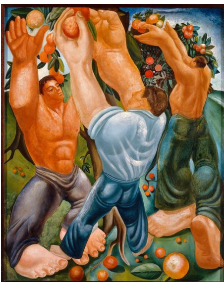
Arthur Ladow (XX e siècle), The Orange Pickers (Les Ramasseurs d'oranges)