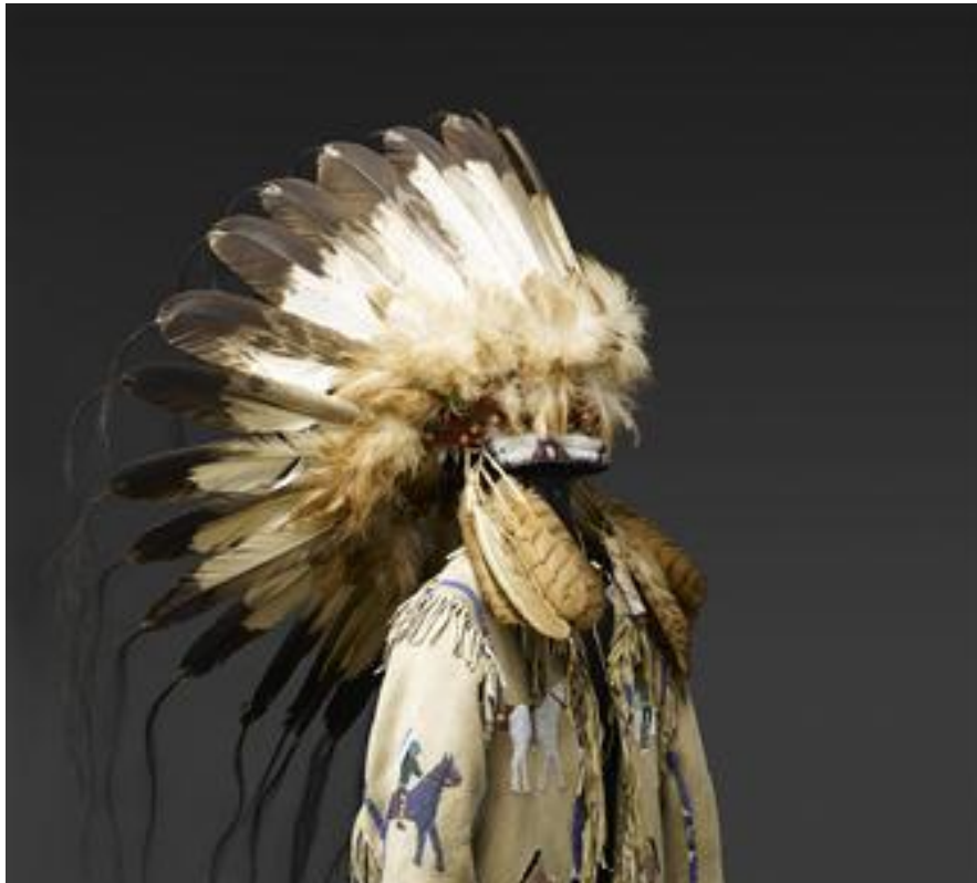
Costume de Spotted Weasel (Belette Tachetée) chef indien

Le musée franco-américain du Château de Blérancourt organise un week-end dédié aux enfants en mettant en valeur ses collections.