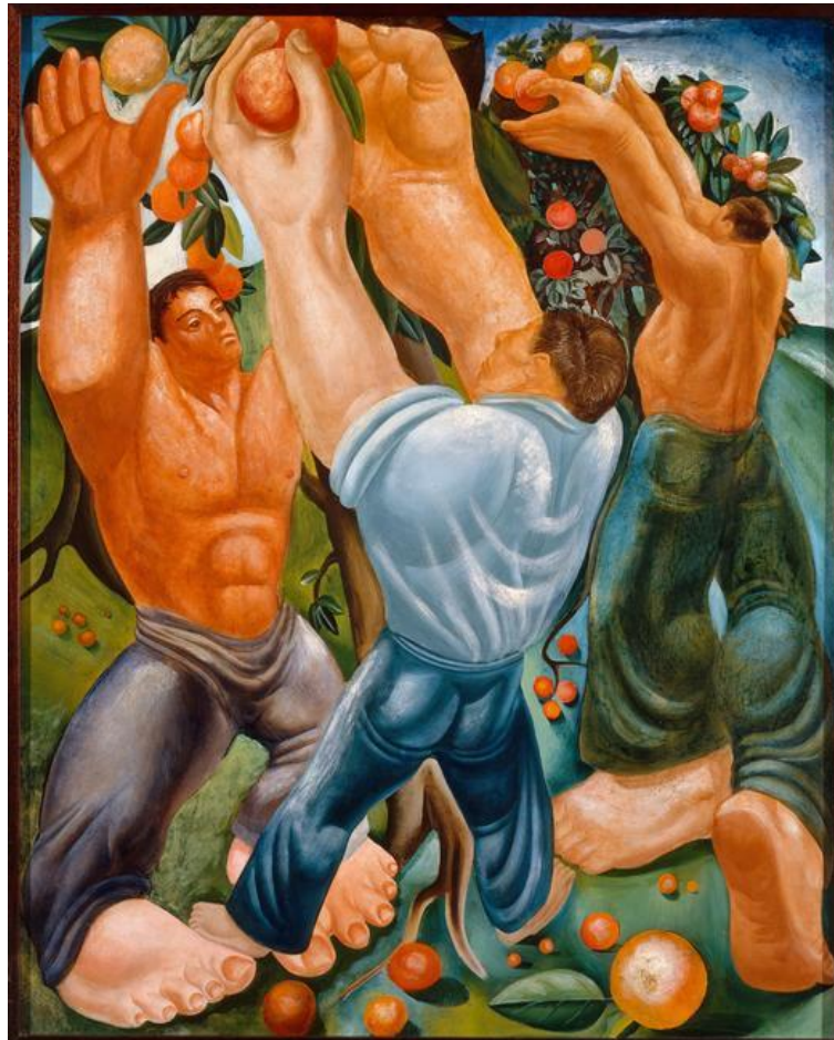
Arthur Ladow (XX ème siècle), The Orange Pickers (Les Ramasseurs d'oranges)

Le musée franco-américain du Château de Blérancourt consacre une exposition à l'art américain de l'entre-deux guerres, entre impressionnisme tardif et réalisme social.