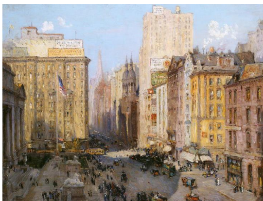
Colin Campbell Cooper, Fifth Avenue, New York, 1913

Du 15 septembre 2021 au 14 février 2022, le musée franco-américain du Château de Blérancourt consacre une exposition aux Villes américaines.