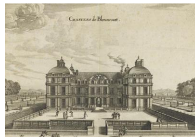
Le château de Blérancourt