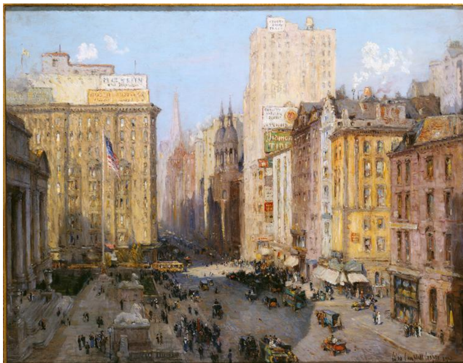
Colin Campbell Cooper, Fifth Avenue, New York , 1913

Du 15 septembre 2021 au 14 février 2022, le musée franco-américain du Château de Blérancourt consacre une exposition aux Villes américaines .