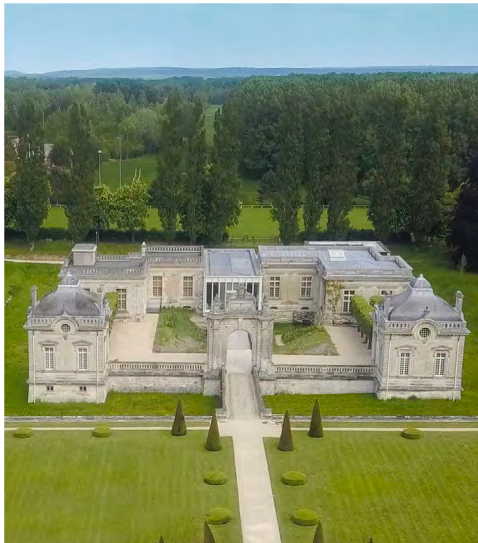
Musée franco-américain du Château de Blérancourt.

Ce musée a fait l'objet d'une importante rénovation et extension en 2017 qui permet de présenter les collections selon trois grande thématiques : les Idéaux des Lumières à l'origine des premières alliances entre les deux nations, les Épreuves pendant lesquelles la France et les Etats-Unis ont combattu côte à côte, et les Arts, sujet de nombreux échanges transatlantiques.