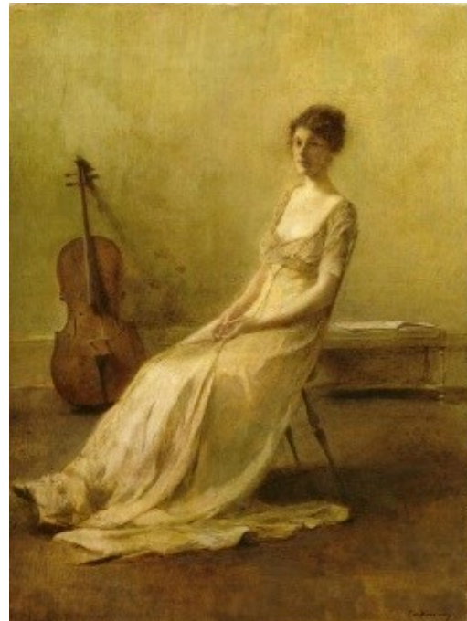
Thomas Wilmer Dewing (1851 – 1938), La Musicienne , huile sur toile, 61,5 x 46 cm, avant 1921.