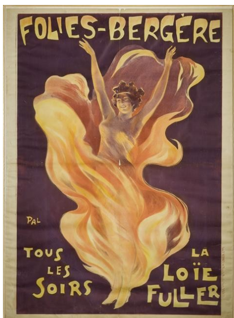
Jean de Paleologu, Folies-Bergère. Tous les soirs la Loïe Fuller , affiche, 132 x 95cm, vers 1897