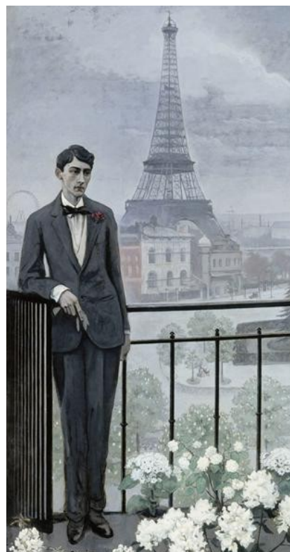
Romaine Brooks, Jean Cocteau à l'époque de la Grande Roue , 1912, huile sur toile, 267 x 149 cm