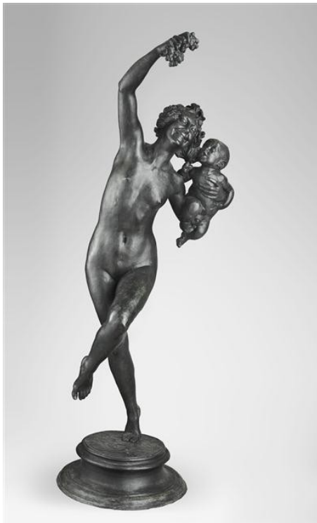
Frederick William MacMonnies (1863 - 1937), Bacchante, statue en bronze, 190 x 68 cm, 1893.